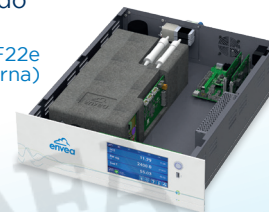
Analizador AF22e (vista interna)